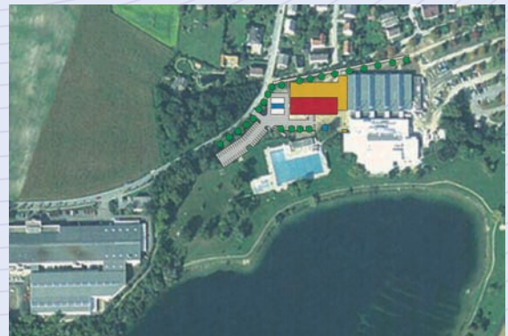
Entwurfstudie - Curling-Leistungszentrum Österreich mit Sporthotel - Badezentrum Traun-Oedt - Luftbildaufnahme M: ca. 1:2000